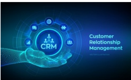
CRM - Kundenbeziehungen