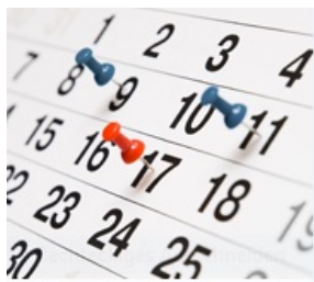
Events / Veranstaltungen